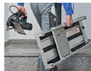
molto comoda da trasportare