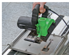
fissaggio della sega senza alcun attrezzo